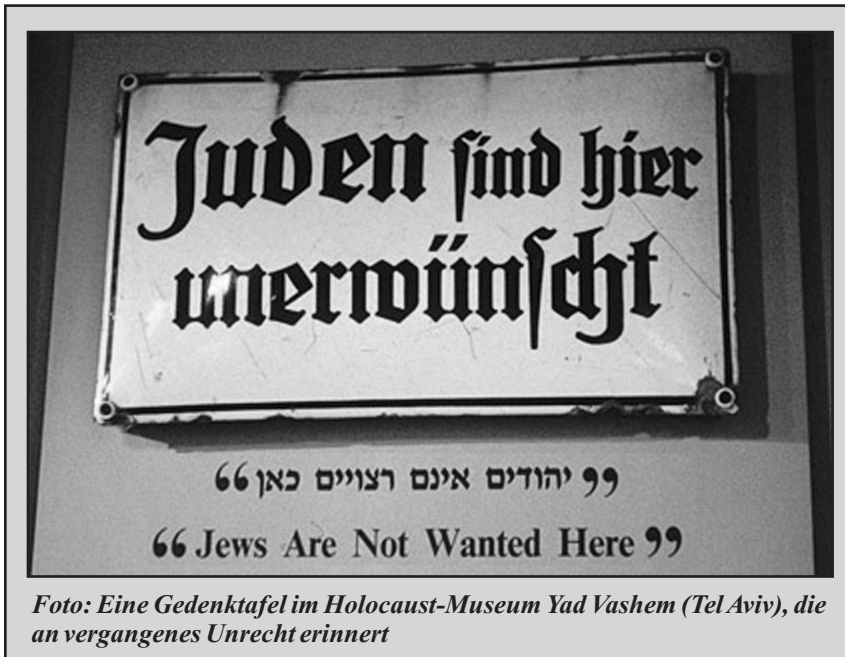
Foto: Eine Gedenktafel im Holocaust-Museum Yad Vashem (Tel Aviv), die an vergangenes Unrecht erinnert