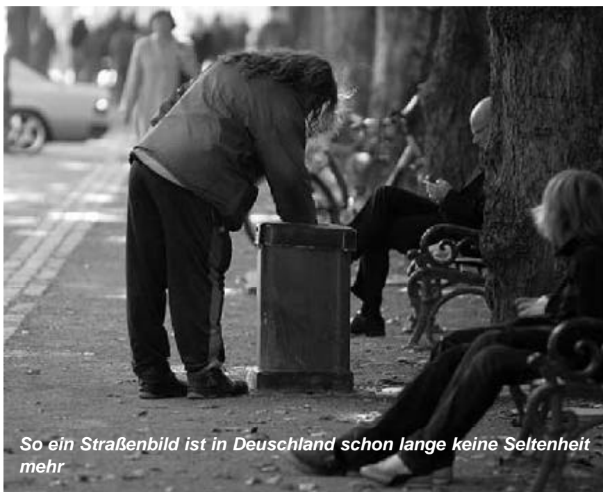
So ein Straßenbild ist in Deutschland schon lange keine Seltenheit mehr

Demnach kamen zu der offiziellen Arbeitslosenstatistik 2004 allein 868.000 Menschen hinzu, die sich in Maßnahmen der BA befanden und daher offiziell nicht als arbeitslos gezählt wurden. In den Kommunen befanden sich