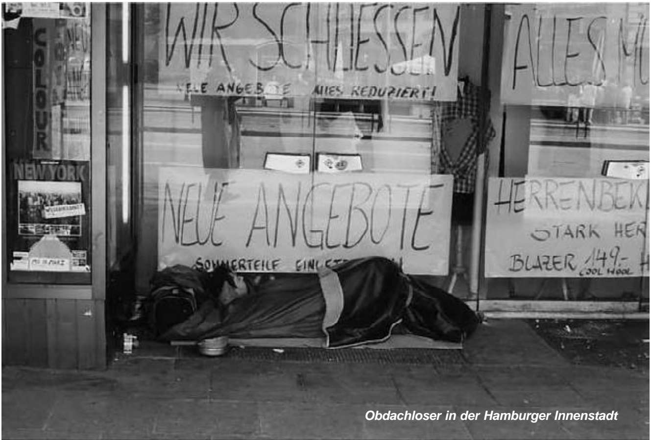
Obdachloser in der Hamburger Innenstadt

Dem Staat fehlen weitere 7 Billionen Euro • Bald 12 Billionen Euro Staatsverschuldung • Fast 10 Millionen Arbeitslose • Armut ist größer als angenommen • 2,5 Millionen Kinder in Deutschland leben in Armut • Pleitewelle rollt weiter • Verbraucherpreise steigen • Reformmurks bis zum Bankrott