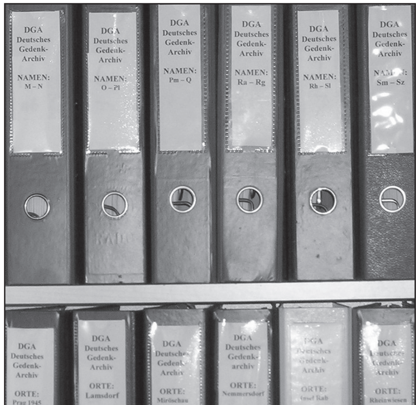
Blick auf einige Ordner des »Deutschen Gedenkarchivs«

Einige zur Veröffentlichung bestimmte Zusendungen aus den letzten Jahren geben wir auf den nächsten Seiten wieder.