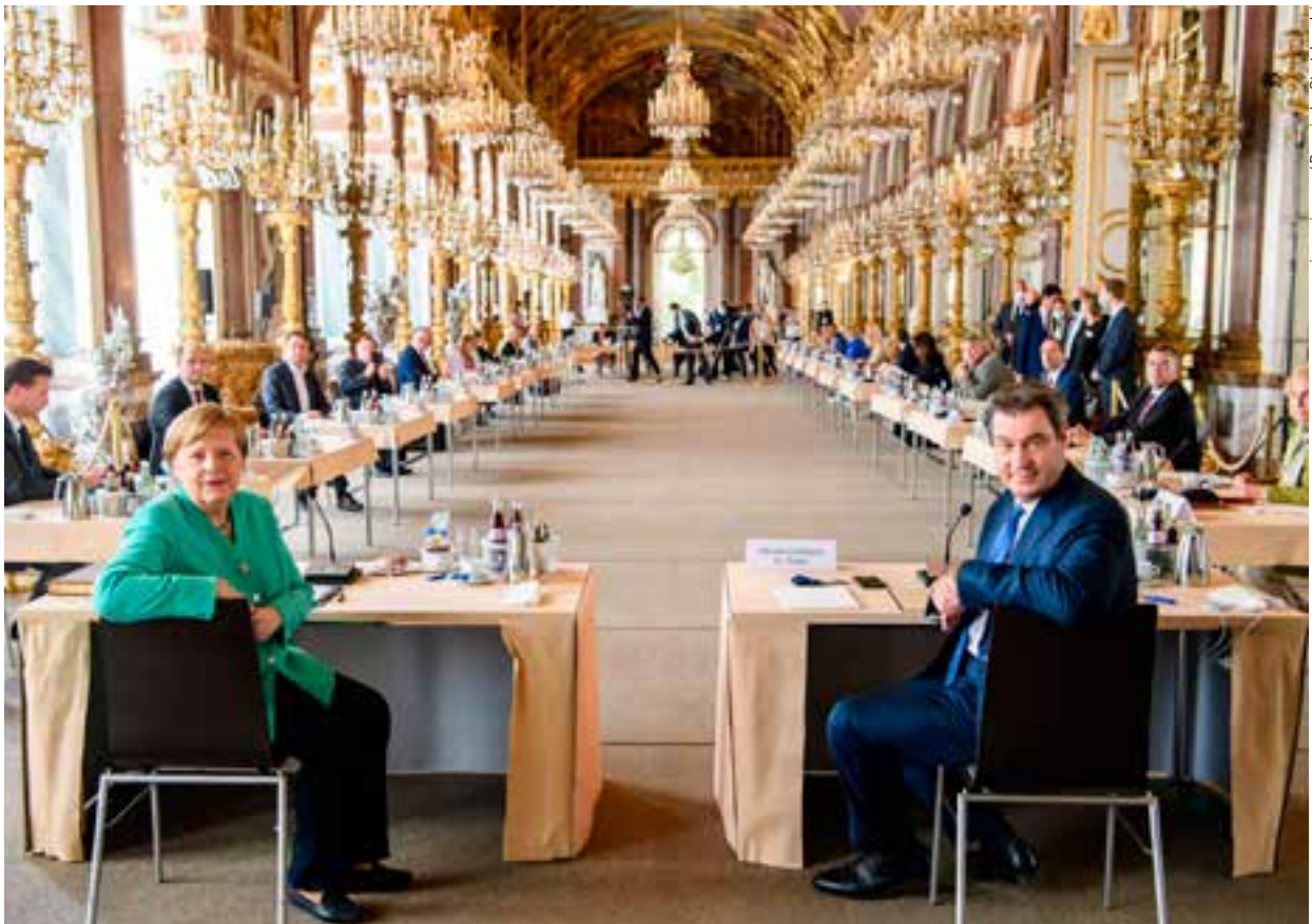
14.7.2020: Bundeskanzlerin Dr. Angela Merkel (links) und Ministerpräsident Dr. Markus Söder (rechts) bei der Kabinettssitzung in der Spiegelgalerie des Neuen Schlosses Herrenchiemsee.

»Wenn sie kein Brot haben, sollen sie doch Kuchen essen!«